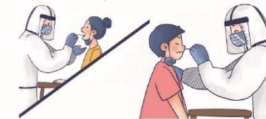
● Výtěr z orofaryngu