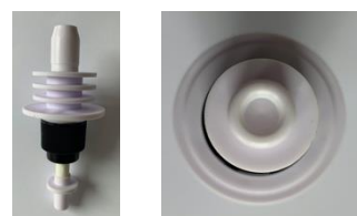
Obr. Pumpička Sprej – v hrotu pumpičky je rozprašovací zátka.